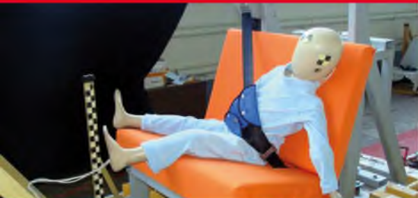
Результаты тестов использования небезопасных удерживающих устройств*

Дополнение определения «направляющая ляжка» в Правилах ЕЭК ООН № 44-04 было одобрено Всемирным Форумом (WP.29). Внесенная поправка к формулировке указывает на то, что «направляющая ляжка» рассматривается как составной элемент детской удерживающей системы и НЕ может отдельно официально утверждаться в качестве детской удерживающей системы в соответствии с настоящими Правилами». Это исключает даже формальную возможность сертификации устройств типа «направляющая ляжка»!